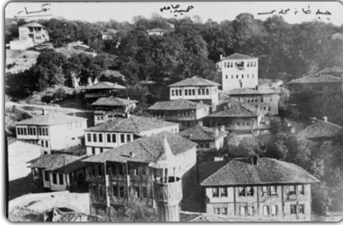
Eski Niksar’dan Görünüm

Sivas vilayeti Tokat sancağına bağlı bir kaza olarak konumunu muhafaza eden Niksar, 1896 yıllarında Ermeni olaylarına tanık olmuştur. Asırlardır beraber yaşadıkları komşularıyla topraklarımızda gözü olan emperyalistlerin kışkırtmalarıyla iki millet düşman olmuştur.