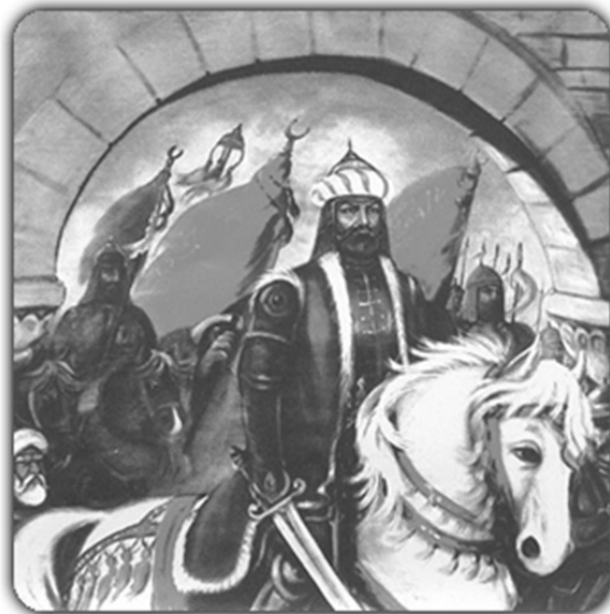
Danışmentli Hükümdarının Niksar'a Girişi

Anadolu'da siyasî birliği sağlamak isteyen Anadolu Selçuklu Sultanı II. Kılıç Arslan, Sivas, Tokat, Niksar ve diğer Danışment illerini 1175 yılında fethetmiştir. Böylece Niksar'da Selçuklu dönemi başlamıştır.