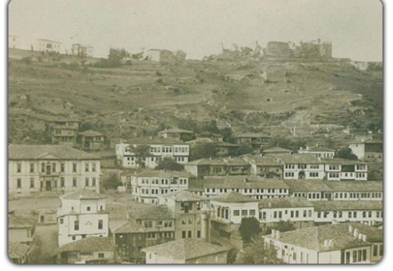
Eski Niksar'dan Görünüm

Günümüzün Niksar'ı zengin, tarihsel ve doğal varlığı ile birlikte modern kent olma çabasını sürdürmektedir.